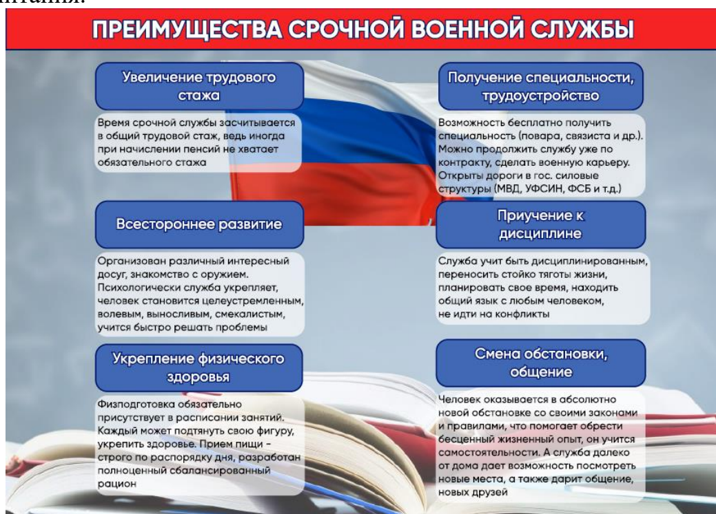
Рис. 1. Памятка о преимуществах срочной военной службы.

Итак, воспитание патриотизма – это целенаправленная и систематическая деятельность школ, училищ, техникумов, вузов, различных молодежных организаций и мест отдыха детей и подростков по формированию у молодежи высокого патриотического сознания, чувства верности своему Отечеству, готовности к выполнению гражданского долга [3, с. 105]. Образовательные учреждения должны воспитывать личность, обладающую этими качествами. Тогда количество дезертирств уменьшится, авторитет Вооруженных сил РФ возрастет, повысится уровень боеспособности армии, и российская армия всегда будет готова встать на защиту Отечества. В статье был раскрыт такой криминологический аспект дезертирства, как предупреждение данного преступления с помощью повышения эффективности патриотического воспитания российской молодежи, а также были предложены меры по повышению качества такого воспитания.