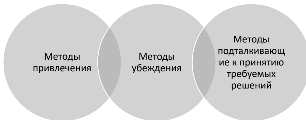
Рис. 2 Инструменты мягкой силы

Один из способов размывания морально-ценностных ориентиров в рамках технологий «soft power» – это героизация зла и отрицательных героев в массовой культуре. «Мягкая сила» (рисунок 2), данное понятие ввел Джозев Най для политики, но оно очень хорошо подходит и под описание с философской точки зрения на влияние киносериала на сознание людей [4].