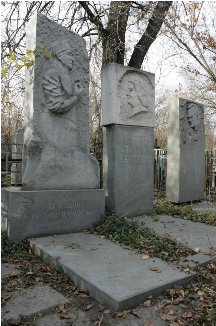
Памятник хирургу А.Н.Сызганову .

Похожая история, (нигде не описанная и восстановленная на основе изучения захоронения) у выдающегося ученого, основателя математической школы Казахстана, академика К.П.Персидского , умершего 22 июня 1970 г. В 1965 г. скончалась его любимая жена Софья Алексеевна (Егорова) , позже трагически погибли два сына. На надгробии жены ученый попросил сделать надпись: «Жди, дорогая, приду». Эти слова сохранились донныне на скромном гранитном памятнике вдалеке от исторической территории, на участке рядом с проспектом Рыскулова. Такой же скромный памятник и у самого Константина Петровича , профессора Казанского и Томского университетов, математика с мировым именем.