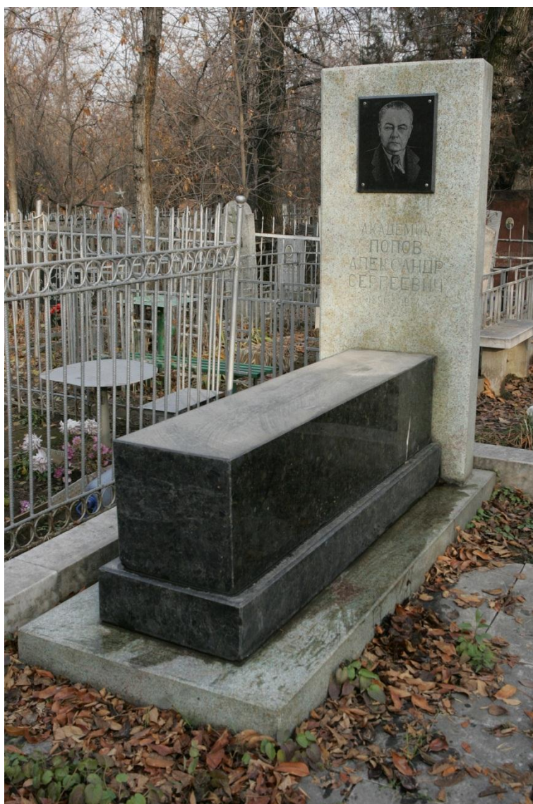
Иллюстрация 9. Памятник академику А.С.Попову .

руды на Курской магнитной аномалии – крупнейшем в мире месторождении магнитного железняка, разработке которого важнейшее значение придавал В.И.Ленин . В 2023 г. этому событию исполняется 100 лет [59].