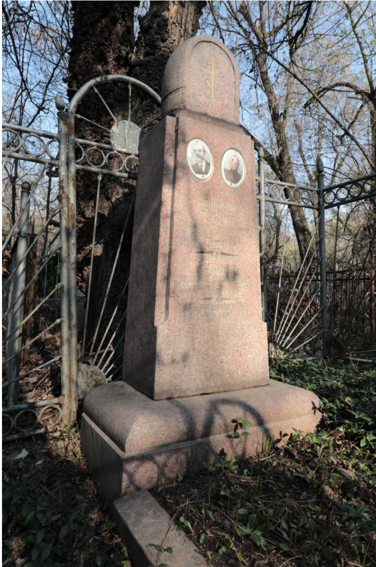
Иллюстрация 7. Памятник астроному, академику Г.А.Тихову .

А захоронение Народного художника Казахской ССР, одного из основоположников казахстанского профессионального изобразительного искусства А.М.Черкасского , похороненного в 1967 г. рядом с центральной аллеей, у которого тоже не осталось родных и близких, найти, увы, уже не удалось.