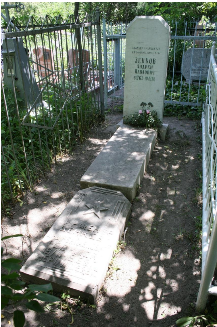
Иллюстрация 1. Памятник архитектору А.П.Зенкову.