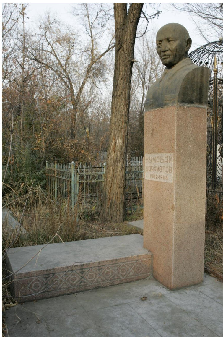
Иллюстрация 4. Памятник Первому секретарю ЦК Компартии Казахстана Ж.Ш.Шаяхметову .

Центральное место в мемориальной зоне занимает захоронение выдающегося государственного деятеля Жумабая Шаяхметова – Первого секретаря ЦК Компартии Казахстана, Председателя Совета Национальностей Верховного Совета СССР, первого этнического казаха, занявшего высший руководящий пост в республике. Бюст из бетона, выполненный по модели скульптора В.Ю.Рахманова (архитектор М.М.Мендикулов ) установлен в 1970 г. (ил.4).