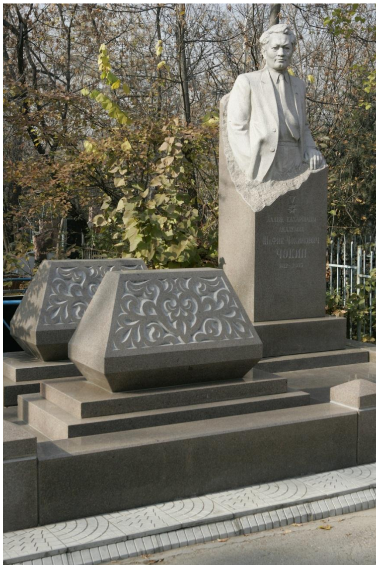
Иллюстрация 10. Памятник Народному Герою Казахстана, академику Ш. Ч. Чокину .

Наш опыт изучения данного некрополя даёт богатый материал для региональной истории и краеведения, основанный на нетрадиционных источниках: перечни похороненных лиц, типология и художественные особенности надгробных памятников, семантика изображений и эпитафий. Включение этого и других историко-мемориальных кладбищ в общее «поле» культуры актуально и потому, что некрополистические исследования вызывают живой интерес, запрос общества на них выражается в популярности экскурсий и литературы соответствующей тематики.