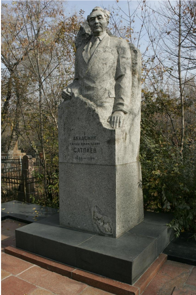
Иллюстрация 6. Памятник Президенту Академии наук Казахстана К.И.Сатпаеву.