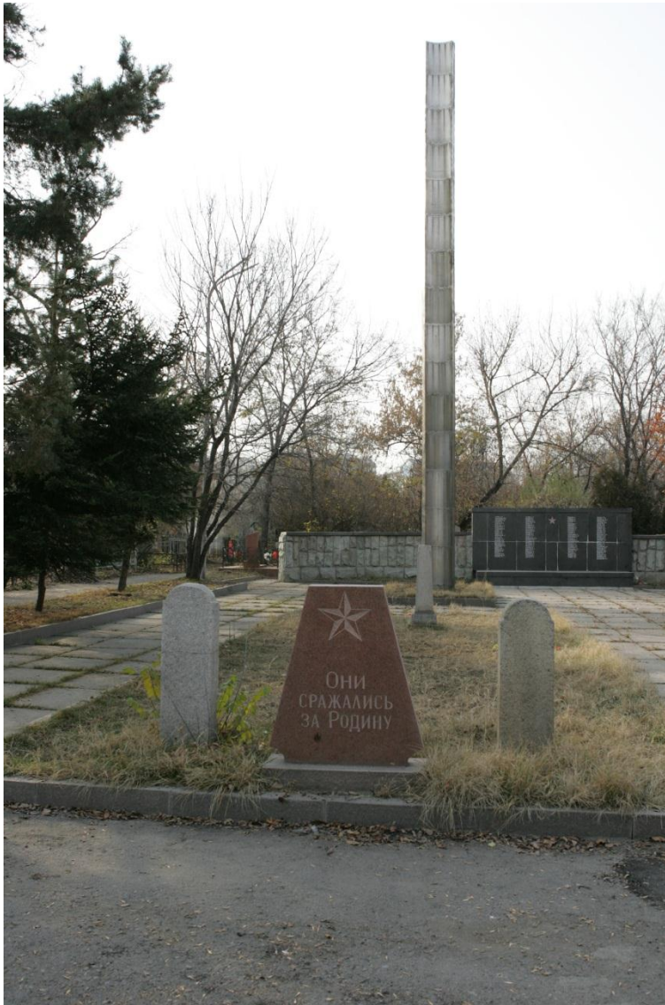
Иллюстрация 2. Мемориал на месте захоронения советских солдат и офицеров на участке № 1.

Мемориал «реконструирован» в 2015 г. к 70-летию Победы: стальная стела (перенесенная на кладбище из парка имени 28 гвардейцев-панфиловцев в 1970 г.) была снесена, на ее месте установлен обелиск из светлого гранита на прямоугольном постаменте с изображением на ордена Великой Отечественной войны, и текстом «Никто не забыт, ничто не забыто». Установленная в 1970 г. гранитная стела с пилоном подверглась непрофессиональной «реконструкции», в результате чего первоначальный вид памятника оказался уничтожен.